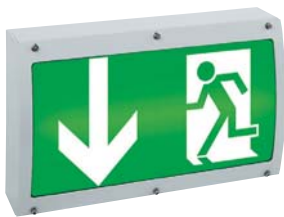
48011 1-3/D LED CGLine IP 54 mit Piktogramm PU