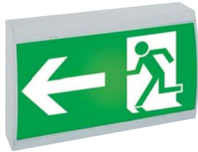
48011 1-3/D LED CGLine IP 41 mit Piktogramm PL