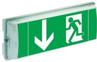
6811 1-3/D LED CGLine mit Haube PU